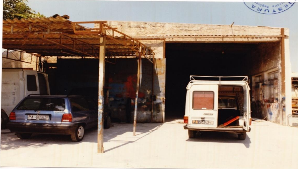
Ril. nr. 3 - Insieme dell'ingresso ai locali dell'officina.-